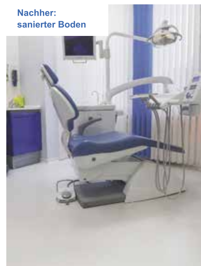
Nachher: sanierter Boden

Richtlinien hinsichtlich aktueller Hygiene-Standards.