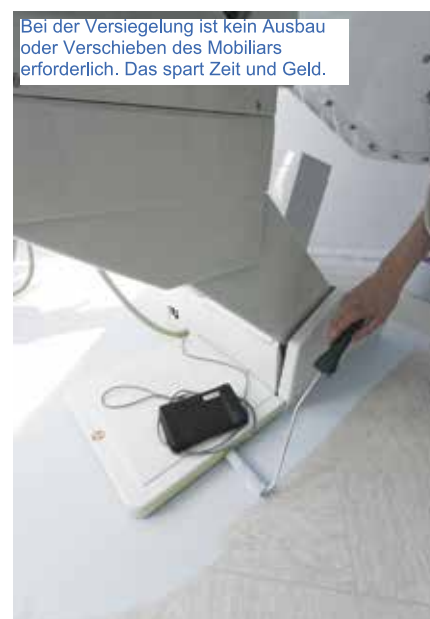
Bei der Versiegelung ist kein Ausbau oder Verschieben des Mobiliars erforderlich. Das spart Zeit und Geld.