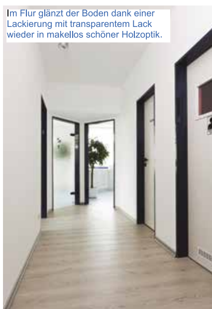
Im Flur glänzt der Boden dank einer Lackierung mit transparentem Lack wieder in makellos schöner Holzoptik.

Dr. Schutz GmbH, Tel.: 0228 9535288, Floor-remake@dr-schutz.com, www.dr-schutz.com/floor-remake