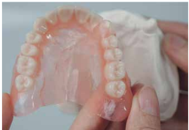
Puro.Flexx® - die Revolution in der Prothetik

Dabei bietet die hohe Elastizität eine hervorragende Bruchsicherheit. Selbst wenn der Patient seine Puro.Flexx®-Prothese bei der Reinigung fallen lässt, kann nichts passieren!